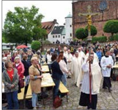
Wallfahrt der Mitarbeitenden zum Kloster Wechselburg.