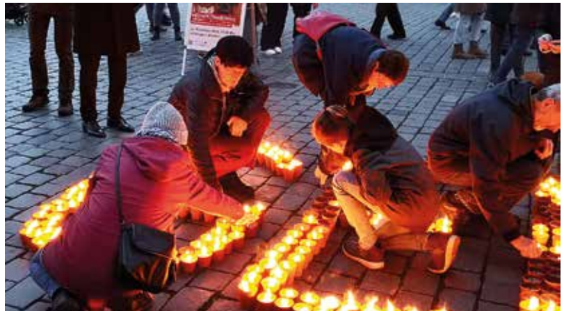
Die Aktion „Eine Million Sterne“ auf dem Dresdner Schloßplatz bildete den Abschluss des 100-jährigen Jubiläums des Diözesancaritasverbandes.

Das Referat Öffentlichkeitsarbeit steuert die Kommunikation des Verbandes nach außen und ist als Zentrales Referat bei der Geschäftsführung angesiedelt. Pressearbeit, Internetauftritt, Veranstaltungen und Gremienarbeit gehören zu den Aufgaben.